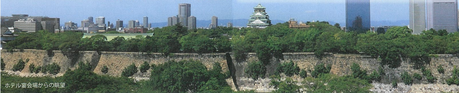
ホテル宴会場からの眺望

阪神高速 13号東大阪線 森ノ宮出口をご利用の際は、 次の森ノ宮入路交差点は直進し、法円坂交差点を 右折し、その先 馬場町交差点を右折して本町通へ